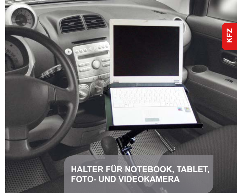
HALTER FÜR NOTEBOOK, TABLET, FOTO- UND VIDEOKAMERA

Für Tablets von 7" – 11" Befestigung mit Aluklammern